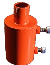
(Pole bracket opzionale)